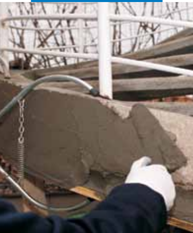
Aplicación mediante paleta de Mapegrout 430