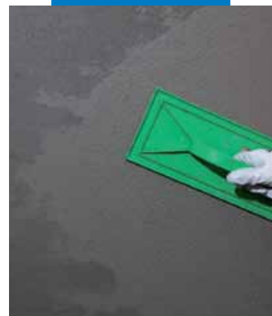
Fratado de Mapegrout 430