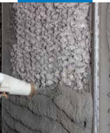
Aplicación por proyección de Mapegrout 430