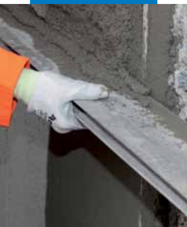
Reglado de Mapegrout 430

a cabo mediante el uso de una máquina revocadora de mezcla continua, tipo Putzmeister MP 25, PFT modelo G4 o G5. Cargar el contenido de los sacos en el interior de la tolva y regular el fluxímetro, en función de la máquina preelegida, de modo que se obtenga un mortero consistente y plástico.